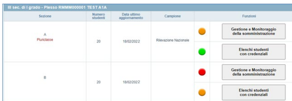
Figura 3: indicatori dei pulsanti “Gestione e Monitoraggio della somministrazione” e “Elenchi studenti con credenziali”

A partire dal secondo giorno della finestra di somministrazione specifica per l’Istituto, accanto al pulsante “Gestione e Monitoraggio della somministrazione” è presente l’indicatore relativo allo svolgimento delle prove (Figura 3).