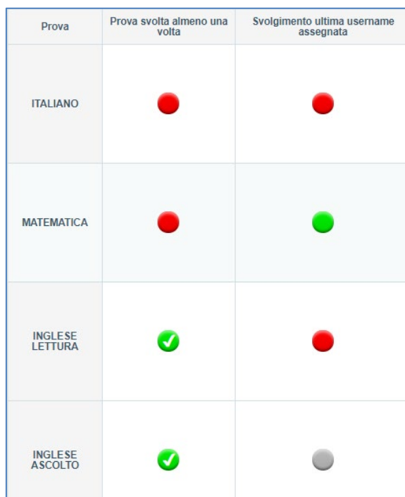
Figura 7: indicatori Svolgimento della prova per il monitoraggio della somministrazione

L'indicatore "Svolgimento ultima username assegnata" segnala se lo studente ha svolto la prova utilizzando le ultime credenziali assegnate. Ciò vuol dire che il colore dell'indicatore è legato alle richieste di modifica delle misure compensative e/o dispensative o di riabilitazione alla ripetizione di una prova eventualmente effettuate dal Dirigente scolastico.