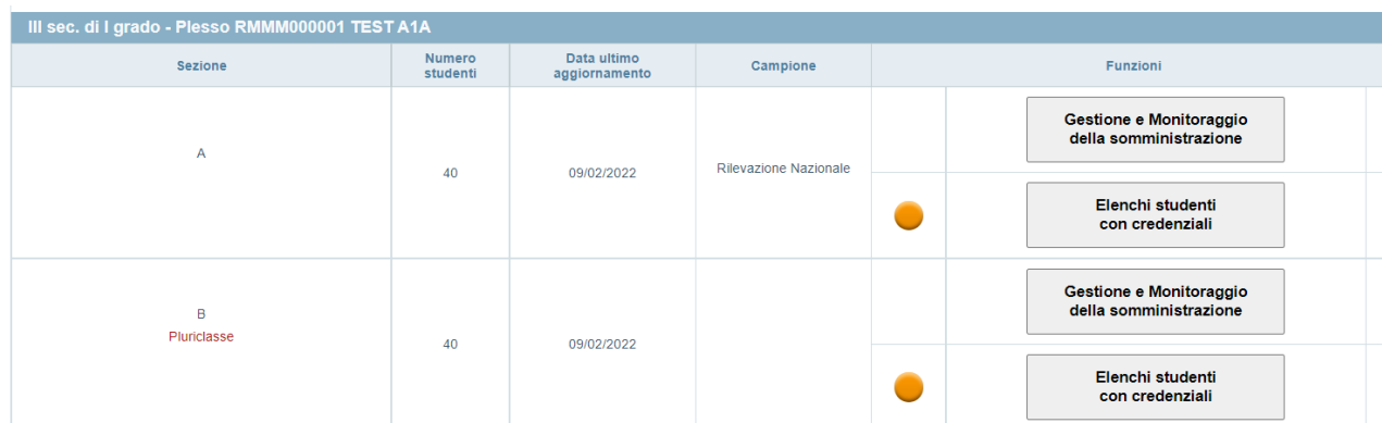
Figura 2: elenco delle classi o gruppi di studenti nel modulo web “Gestione e Monitoraggio della Somministrazione CBT”

Il modulo web “Gestione e Monitoraggio della Somministrazione CBT” visualizza, per ciascun grado, l’elenco delle classi o gruppi di studenti dell’istituto che somministrano le prove INVALSI computer based (CBT) (Figura 2).